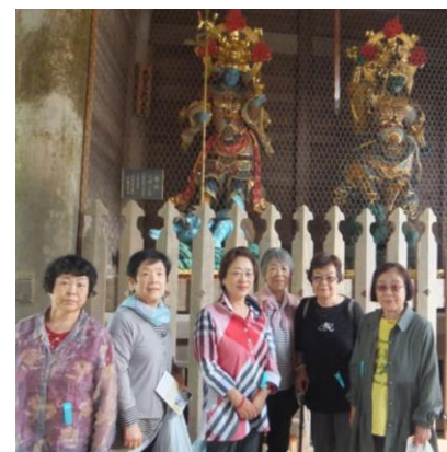
～永平寺にて～ お寺の中はとても階段が多かったですが、最上部まで拝観された方もいらっしゃいました。