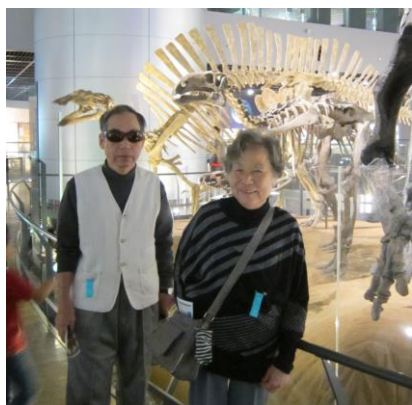
～恐竜博物館にて～ 大きな恐竜のモニュメントや化石の展示はとても迫力がありました。