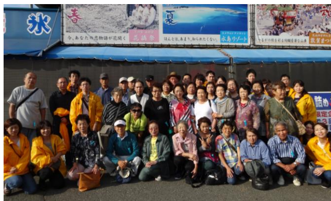
～日本海おさかな街にて～ 魚や蟹などの海産物のお土産を買いました！ スタッフも合わせ総勢47名で行きました。