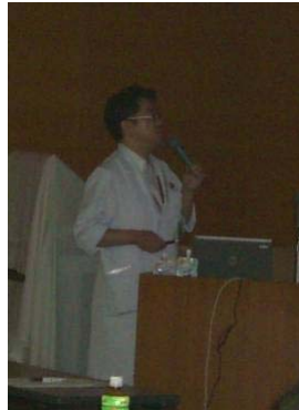
栄養評価 グループ