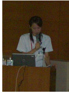
静脈栄養 グループ