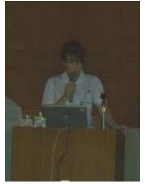
摂食嚥下・口腔ケア グループ