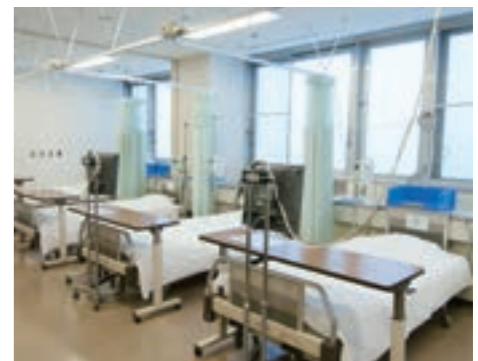
松波総合病院化学療法室では、肺がん、乳がん、前立腺がんなどの抗がん剤治療を外来で行っています。

数年前までは、抗がん剤治療は、吐き気などの副作用が強く、何ヶ月も入院して行うことが普通でした。しかし、ここ数年の間に治療効果の高い薬が次々に開発され、また副作用に対する治療も進歩したことにより、外来通院で肺がんの抗がん剤治療が行えるようになりました。松波総合病院では、平成21年に「外来化学療法室」を開設し、これまで繰り返し入院して治療しなければならなかった抗がん剤治療が、家庭で生活しながら、あるいは仕事を続けながら、外来で行うことができるようになりました。さらに薬剤の工夫で、短時間でかつ楽に、質の高い治療を行っています。外来の抗がん剤治療についてお問い合わせ、ご相談があればいつでもご連絡ください。