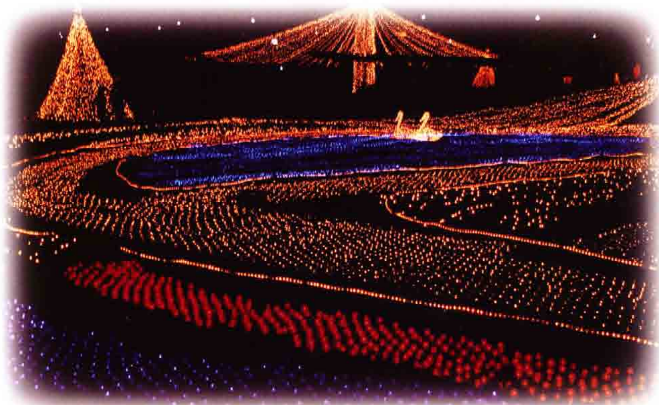
木曾三川公園 西宮町