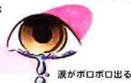
涙がポロポロ出る