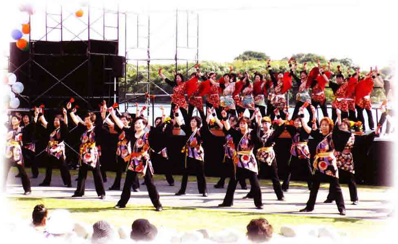
10月18日笠松リバーサイドカーニバル2009 よぎこいソーラン 桜町