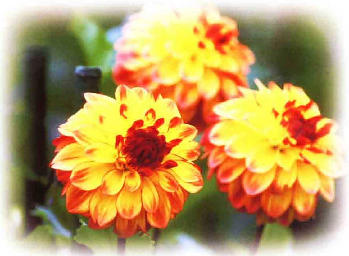
なはなの里にて