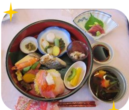
とても彩りの良いお弁当でした