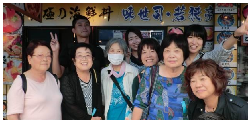
お魚市場で沢山買い物もしました♪