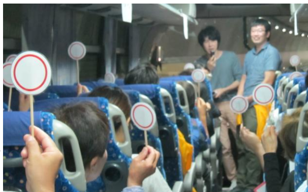
毎年恒例の糖尿病クイズ大会も実施しました!

9月25日(日)に糖尿病教室秋の野外実習会を開催しました。 福井～御食国若狭おばま食文化館・敦賀昆布館～へ行ってきました!