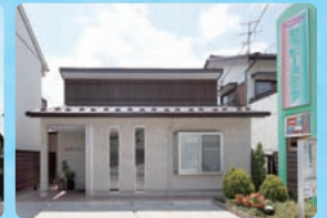
セラピースクエア (カウンセリング専門施設)