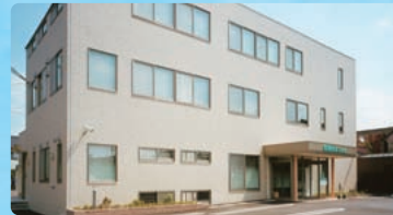
笠松クリニック (診療所・デイケア・ナイトケア)

当院のホームページにて、心と体に役立つ情報を提供しています。是非アクセスしてみてください。