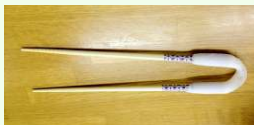
⑤完成!! ここから個別性に合わせた箸にするため 微調整を繰り返します (完成に数日要します)

その他に、介護用品でユニバーサルデザインの「箸」や「スプーン」「お皿」の提案もさせていただきます。お気軽にお声掛け下さい。