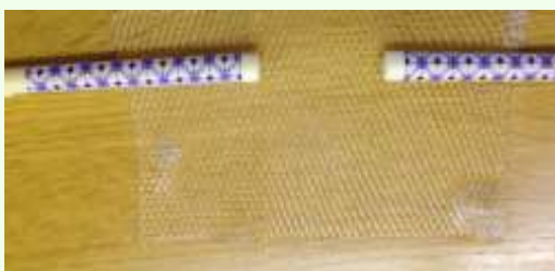
④熱いうちに取り出して形を作る 冷めると固まるため時間との戦いです