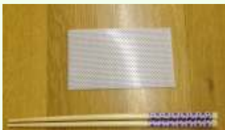
①箸とプリント素材を用意する。