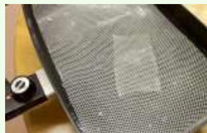
③熱を加えると固かった素材が こんにゃくのようになります