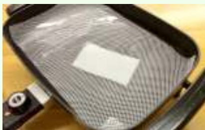
②専用のプレートで暖める